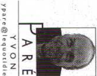
Y V O N

Dans le nouvel espace, une exposition plus modeste qui occupe deux vastes salles. L'ancien magasin d'antiquités a été rénové. «Sorry» regroupé une dizaine d'artistes qui n'ont rien à envier à ceux que l'on retrouve rue Gaucher. De très grandes photographies, des installations et des tableaux qui questionnent encore nos façons de voir.